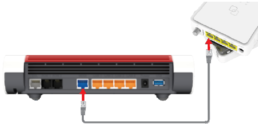
Abb. 1: FRITZ!Box per LAN-Kabel mit dem ONT verbinden

HINWEIS: Wenn Sie die FRITZ!Box bereits an das Stromnetz angeschlossen haben, trennen Sie das Netzkabel und stecken Sie es wieder ein, um die FRITZ!Box neu zu starten.